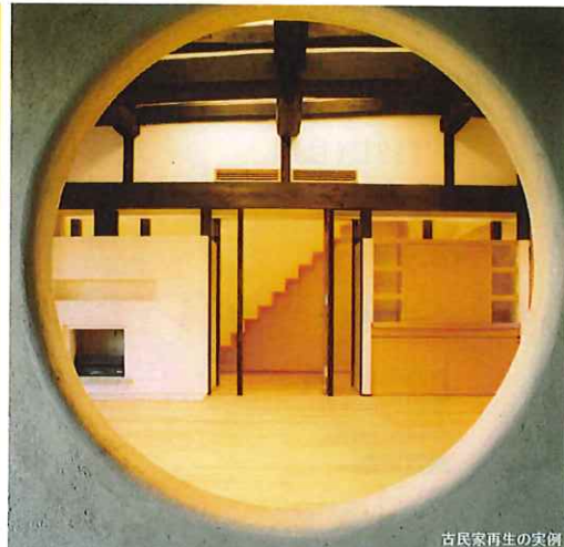
古民家再生の実例