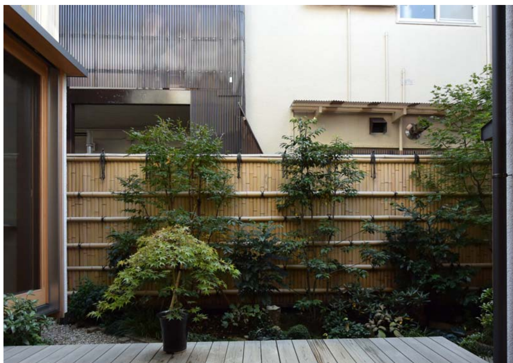
都会の密集地でも、四季の移ろいを感じながら暮らしています