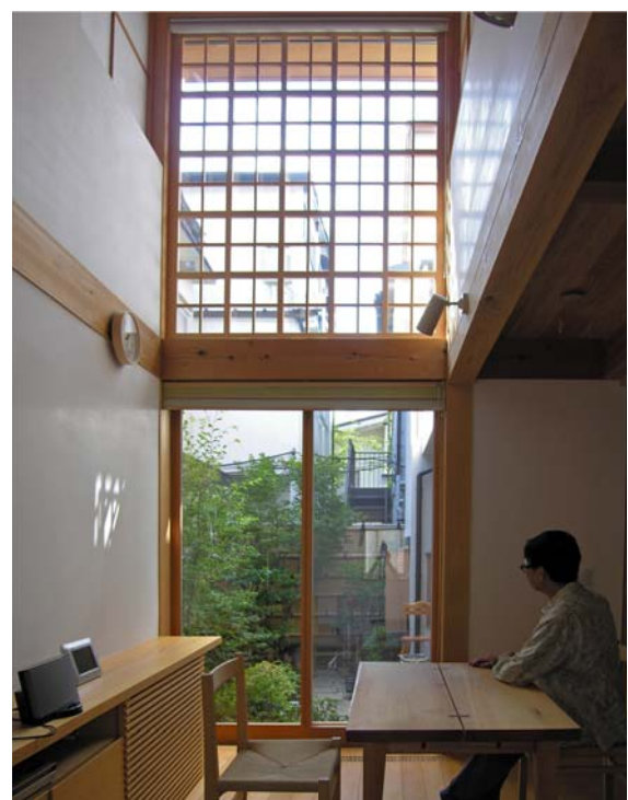
西日を楽しむ「浄土寺格子」

設計：松井郁夫建築設計事務所 施工：キューブワンハウジング 山：天電・S・ド・フライングチーム協同組合