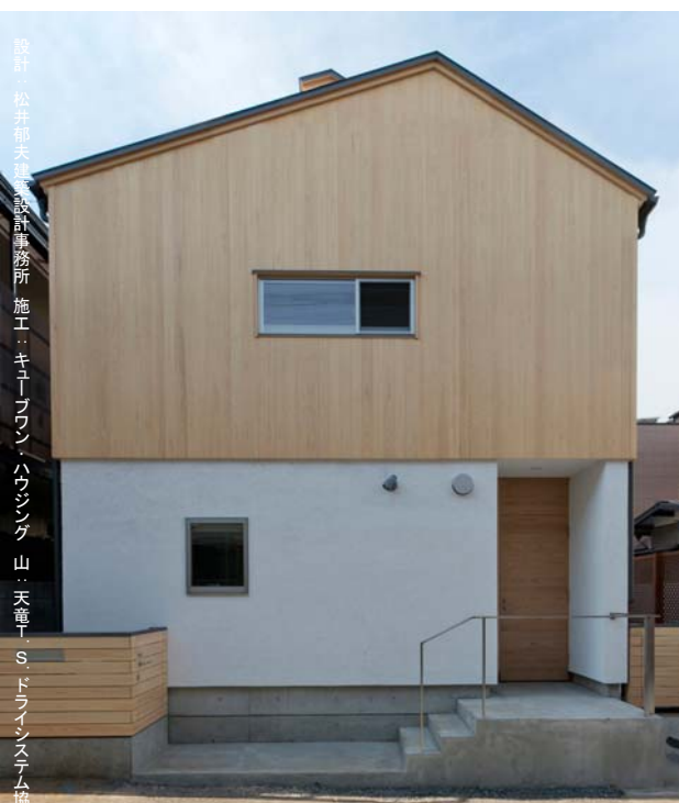
新防火地区でも無垢板張りの外観です