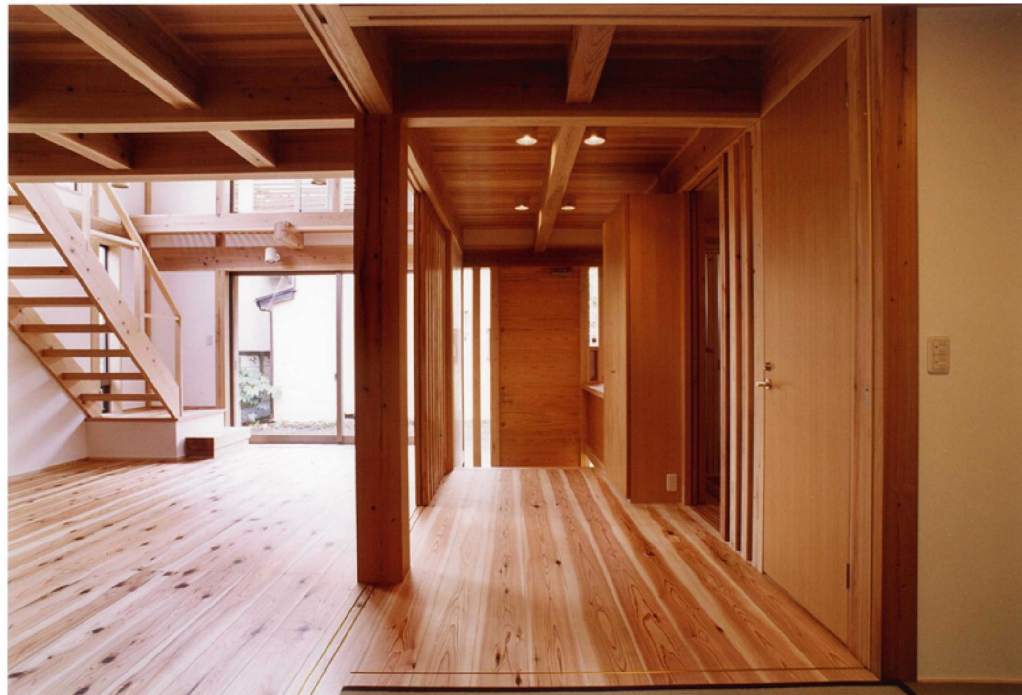
写真 右上 階段部分 左上 南側外観 右下 居間 左下 和室