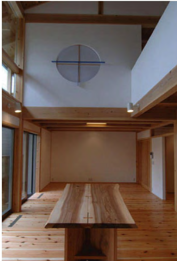
写真左上：庭側外観 左上：和室 右上：居間