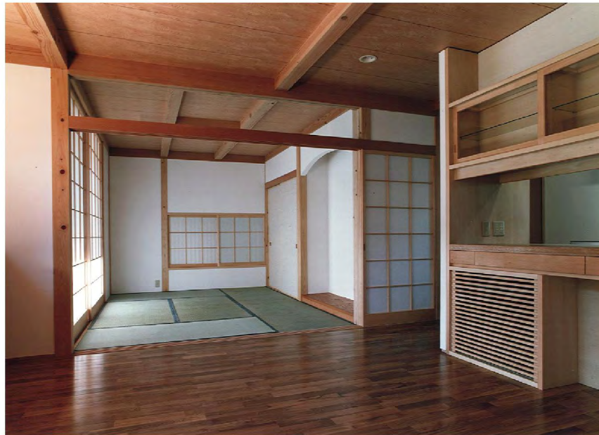
写真上左：居間より玄関ホール 下左：外観 上右：吹抜 下右：居間