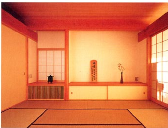
写真左上: 2階広縁(物干) (撮影 木下大造) 下: 1階茶ノ間 (撮影 米畑勝行) 右上: 外観(南) (撮影 木下大造) 下: 1階茶ノ間より居間 (撮影 木下大造)