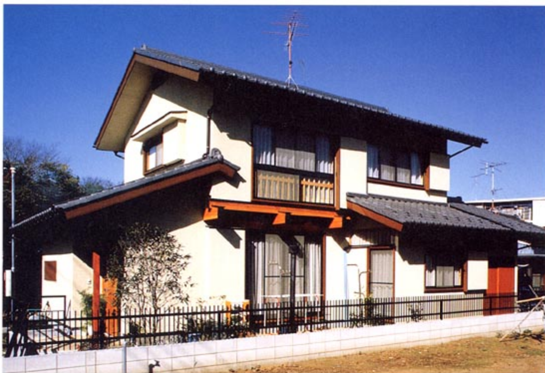
写真上左：1階食堂 (撮影 松井郁夫) 上右：階段室 (撮影 米畑勝行) 下：外観(南) (撮影 松井郁夫)